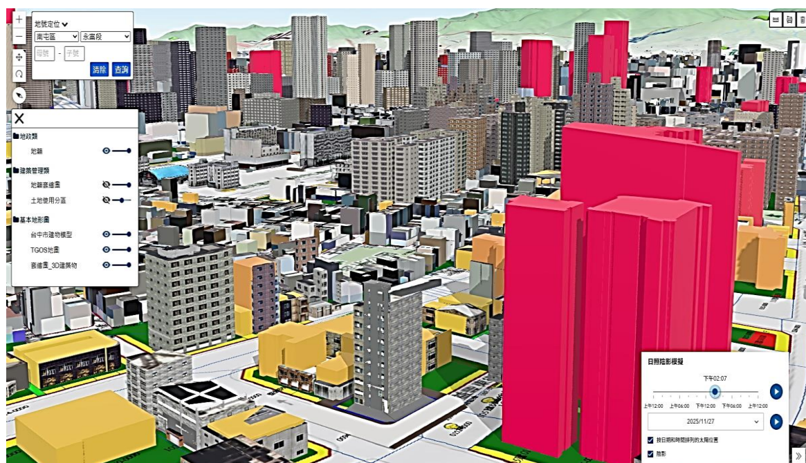
圖 4 3DGIS 輔助審議系統示意圖