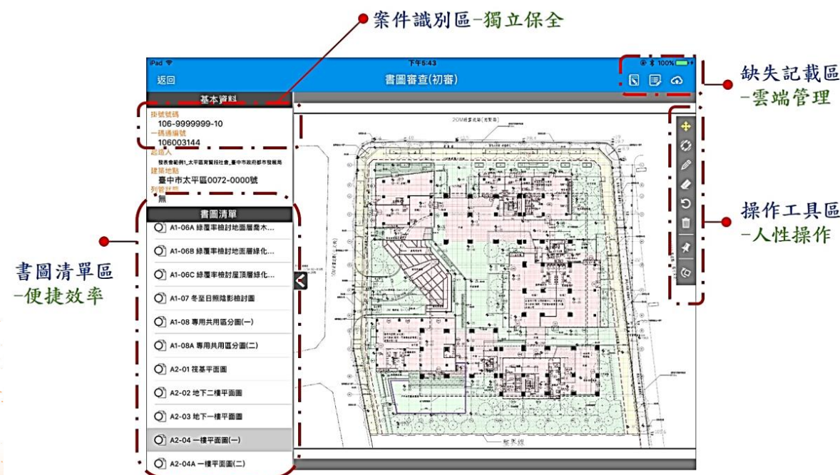
圖 5 無紙審照系統示意圖