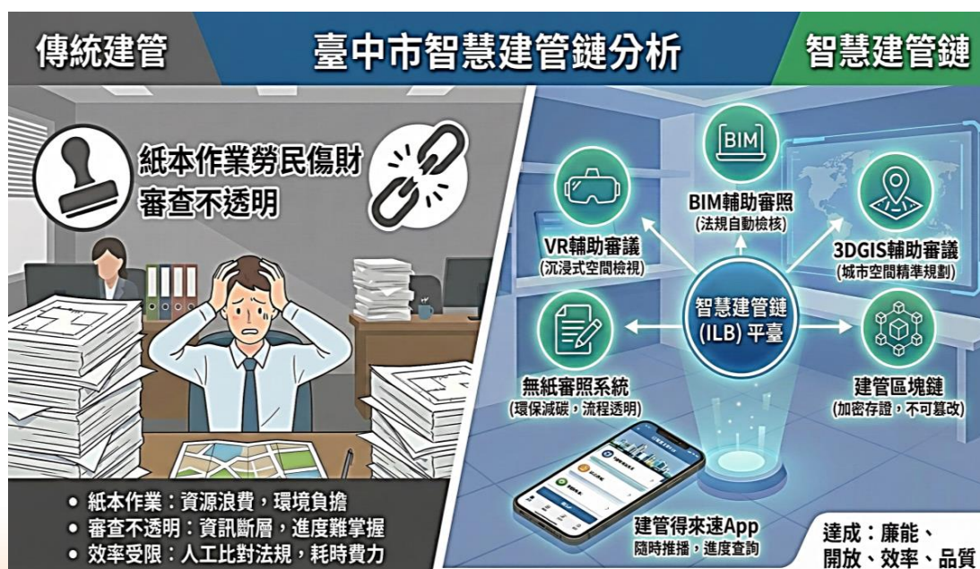
圖 1 建築管理數位轉型：從傳統模式到智慧建管鏈

現行紙本審查機制下，案件各階段之處理進度與審查結論無法即時公開，申請人及管理端皆難以即時掌握案件狀態，導致行政流程透明度不足，影響民眾對政府服務之信任。