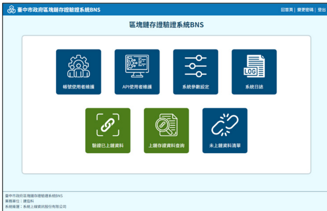
圖 6 智慧建管區塊鏈系統示意圖

接對電子檔加密防偽。因應推動「無紙 歸檔」之防偽作業，都發局導入區塊鏈 技術，對核准建照電子檔案加密上鏈， 使用者可透過手機、電腦等行動裝置， 於建管區塊鏈平臺驗證電子檔案真偽， 提升政府信任。