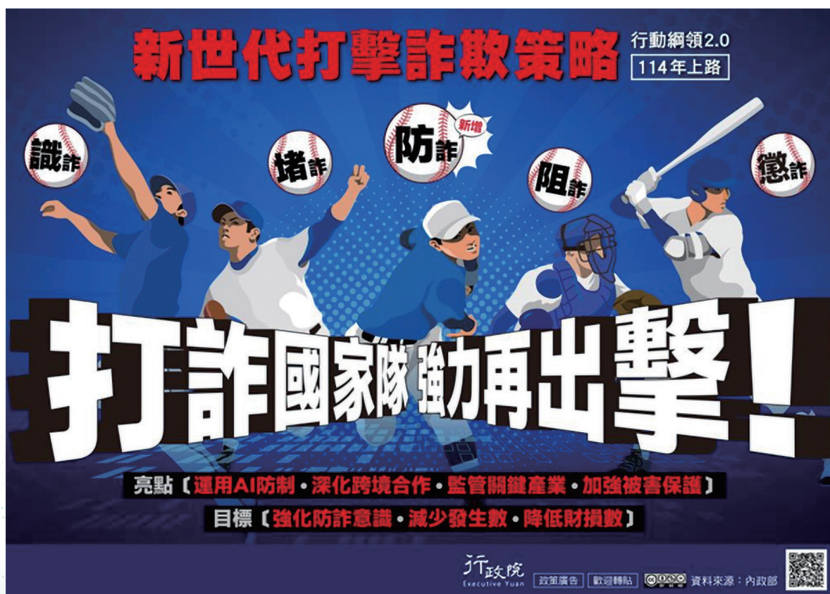
圖4 加大力道全方位打擊詐欺

技偵查法制化）及洗錢防制法（下稱打詐新4法），並經總統於113年7月31日公布。行政院為因應打詐新4法之施行，有效應對新型態詐欺犯罪，旋即於同年11月28日通過打詐綱領2.0版，新增「防詐」（數位經濟面），強化數位經濟產業治理，並自114年1月1日起施行，以「運用AI防制」、「深化跨境合作」、「監管防詐產業」及「強化被害人保護」為亮點，落實「強化防詐意識、減少發生數、降低財損數」為目標（圖4）。臺高檢署為提升阻詐、懲詐成效，另推動「可疑帳戶預警