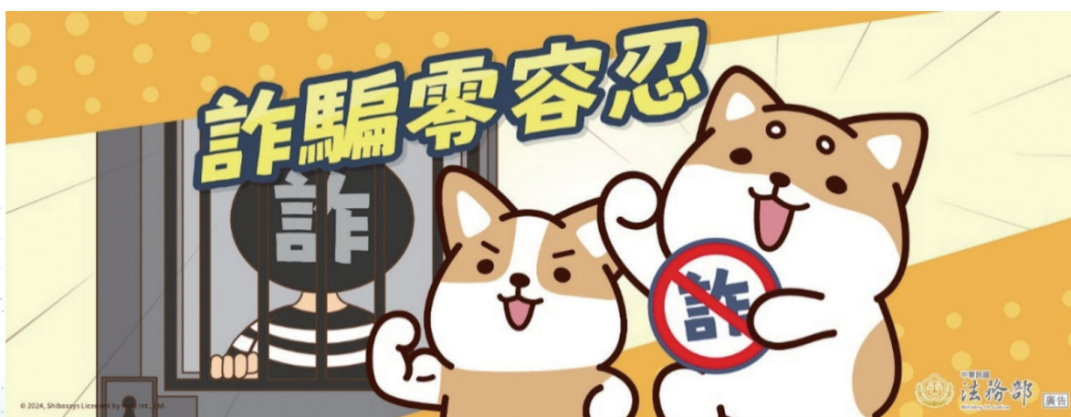
圖 2 戒除貪念－詐騙零容忍

為落實執行打詐綱領，法務部召集 Meta、Google、Line 等平臺業者開會研商並建立資料調取、即時下架詐欺廣告等機制，以縮短查調取得詐騙資訊時效，防止無辜民衆遭受詐欺。對於詐欺犯、詐騙車手等受刑人，法務部並從嚴審核有無類似犯罪紀錄，對於沒收之犯罪所得有無如實繳納，有無與被害人和解或賠償等情況，作為是否准予假釋之依據，促使詐騙犯返還民衆受詐金額，以防止其他潛在犯罪者群起效尤，降低詐騙犯再犯率。此外，臺