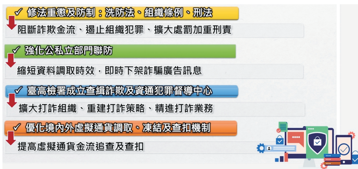
圖 3 打詐綱領 1.5 版策進作為及預期效益

同）22 億元 1 。然而全球詐騙環境依然嚴峻，詐騙手法日益千變萬化，詐騙犯罪型態變化快速，從傳統的電話、簡訊詐騙，演變成利用網路投放假徵才訊息、假冒檢警辦理帳戶監管，近年來更是利用生成式 AI 技術製造深偽影音（如 ChatGPT、DeepFake）遂行詐騙。為此，行政院重新盤點打詐策略、人力、物力及經費，於 112 年 5 月 4 日通過打詐綱領 1.5 版，精進「識詐、堵詐、阻詐、懲詐」四大面向，並修正刑法、個人資料保護法、洗錢防制法、人口販運防制法暨證券投資信託及顧問法等打詐 5 法（圖 3）。其中，刑法第 339 條之 4 第 1 項第 4 款增訂：「以電腦合成或其他科技方法製作關於他人不實影像、聲音或電磁紀錄之方法犯之。」者，