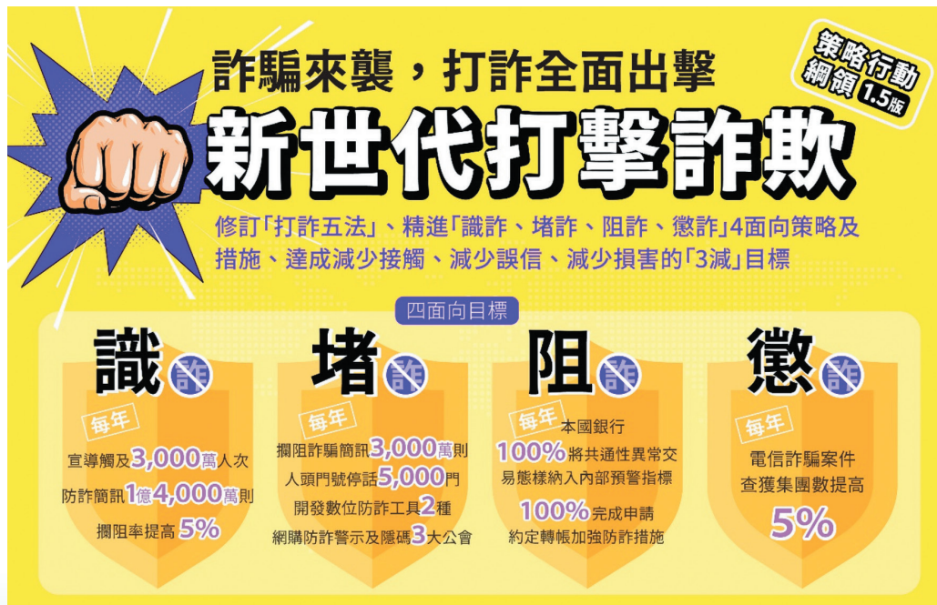
圖 3 打詐綱領 1.5 版重點簡介