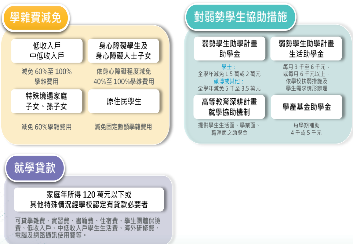
圖 2 大專校院弱勢學生就學階段扶助措施