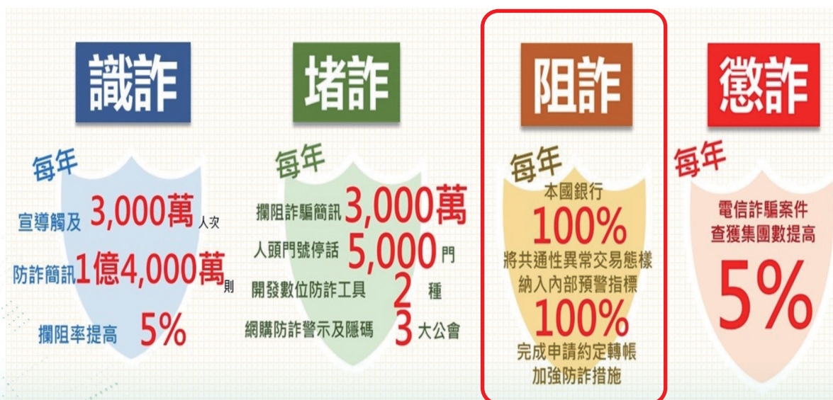
圖 1 打詐綱領 1.5 版 4 大面向分項指標