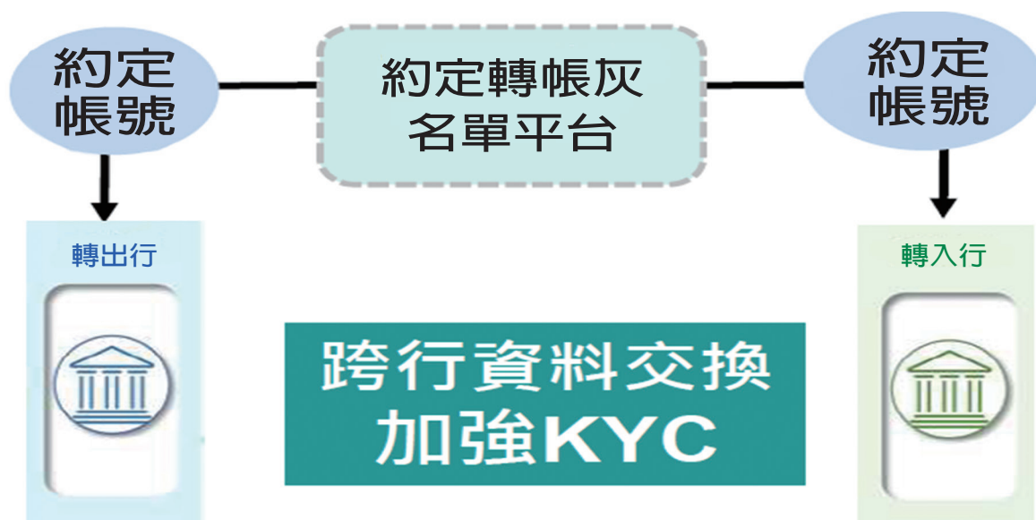
圖 3 約定轉入帳號灰名單通報平台

公布洗錢防制法第 15 條之 2（113 年 7 月 31 日修正公布全文，改置第 22 條）明定「不正交付帳戶罪」。據金管會統計，自「不正交付帳戶罪」施行以來，國內金融機構警示帳戶之增幅已自 112 年第 2 季起逐步下降，惟截至 114 年 3 月底止，國內金融機構警示帳戶數仍高達 15 萬餘戶。又因詐騙集團可利用變更營業登記項目等方式，規避主管機關監理或警察機關查緝，致迭有虛設公司行號之情事發生，並藉由企業帳戶易以投資或支付貨款為由，規避不法交易之警示及研判，成為洗錢防制漏洞。嗣經行政院督促檢討結果，經濟部商業發展署已於公司登記與管理資訊系統新增提示，並將第三