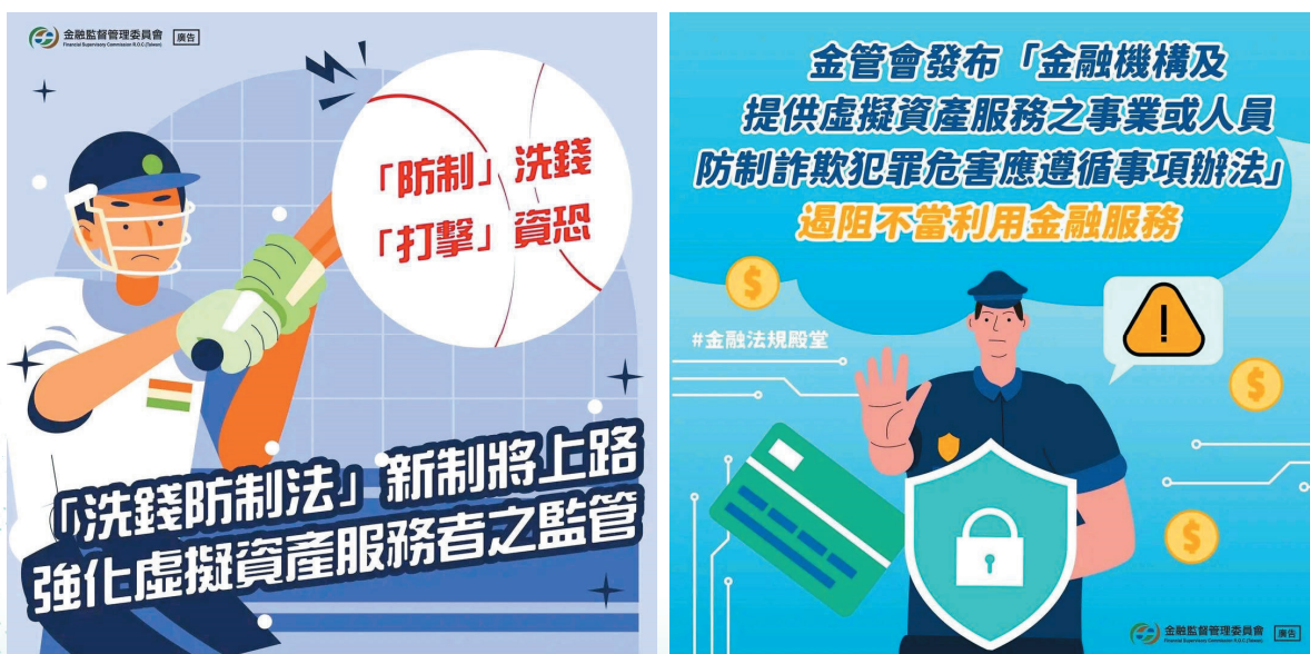
圖 4 金管會推動 VASP 相關規範

政府為加強對虛擬資產之監管，於 113 年間積極推動 VASP 相關阻詐規範及業者自律管理，金管會並於 114 年 3 月間提出虛擬資產服務法草案，及於同年 6 月 27 日陳報行政院審查。又內政部警政署為加速偵辦虛擬資產詐騙案件，追回民衆財產損失，已與幣安 (Binance) 等 12 家境內外 VASP 業者建立投單調閱等合作機制，鑑於金管會已就虛擬資產建立初步監管規範 (圖 4)，惟虛擬資產服務法尚在